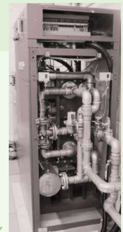
温調装置類参考写真