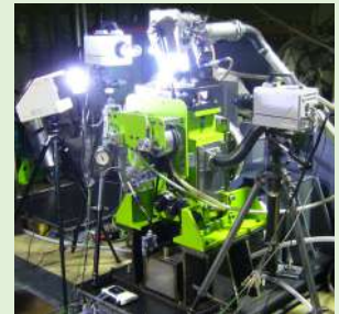
弊社可視化試験システムを使用した高速度カメラ撮影